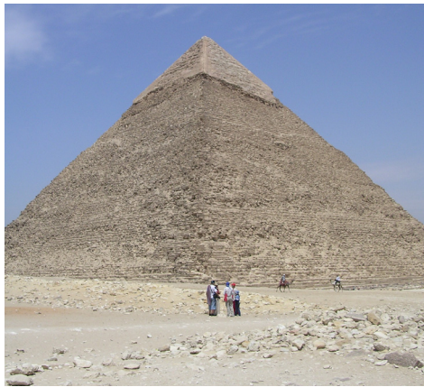
Algunos ritos egipcios tenían lugar en el interior de las Pirámides

De igual modo, al antiguo Egipto se remonta el Libro de las enseñanzas de los escribas en el cual se establece el orden protocolario entre autoridades a la par que relata los ritos y ceremonias en los que estaba presente el faraón.