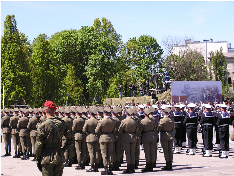
Protocolo militar en un desfile militar.

Ejemplos: celebración del día de la Fiesta Nacional de España, celebración de la Pascua Militar.